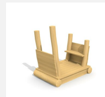
XL.3.01.03 Remorque sans toit