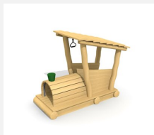
XL.3.01.01 Jim's Locomotive en bois de robinier