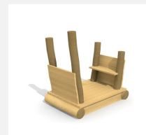
XL.3.01.03.L Remorque sans toit - lasuré