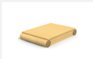
XL.3.01.04.L Remorque plateforme - lasuré