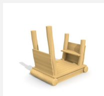
XL.3.01.03 Remorque sans toit