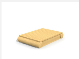
XL.3.01.04 Remorque plateforme