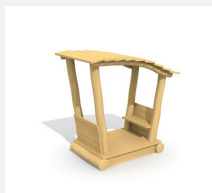
XL.3.01.02 Remorque avec toit