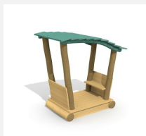
XL.3.01.02.L Remorque avec toit - lasuré