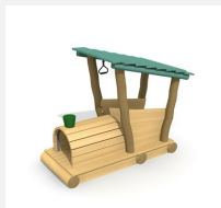
XL.3.01.01.L Jim's Locomotive en bois de robinier -