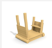
XL.3.01.03 Remorque sans toit