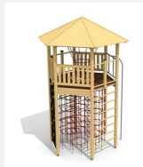
XL.010 Tour hexagonale XL