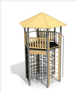
XL.010.M Tour hexagonale XL