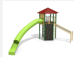
XL.011.L Tour hexagonale XL 011 toboggan, lasure en