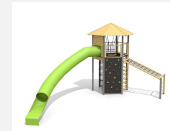
XL.011.M Tour hexagonale XL 011 toboggan virage