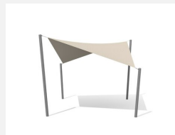
WS.010.4 Voile-parasol 4 x 4 m