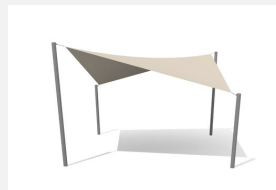
WS.010.5 Voile-parasol 5 x 5 m