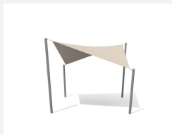
WS.010.3 Voile-parasol 3 x 3 m