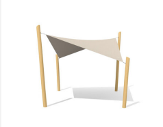
WS.010.3.R Voile-parasol 3 x 3 m nature