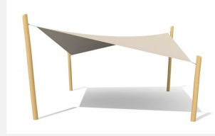
WS.010.6.R Voile-parasol 6 x 6 m - nature