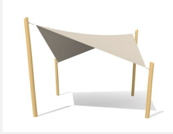
WS.010.5.R Voile-parasol 5 x 5 m nature