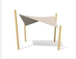
WS.010.4.R Voile-parasol 4 x 4 m nature