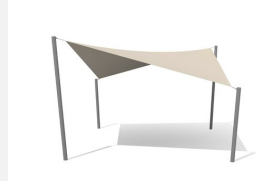
WS.010.5 Voile-parasol 5 x 5 m