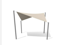
WS.010.4 Voile-parasol 4 x 4 m