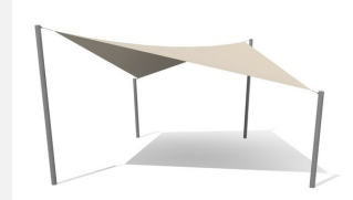
WS.010.9 Voile-parasol sur mesure