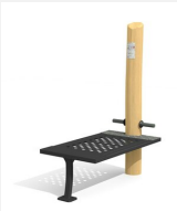
UF.6416.R Abshape nature