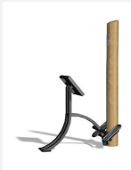
UF.6419.R BackShape nature