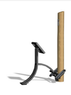
UF.6419.R BackShape nature