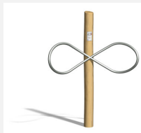
UF.6084.R Ying Yang nature