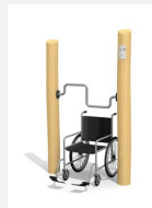
UF.6153.R Handbike Handicap