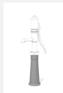
SW.131.3 Support de pompe 40