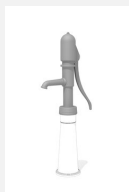
SW.131.2 Pompe à bras