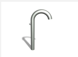
SW.132.3 Distributeur d'eau en inox