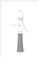
SW.131.3 Support de pompe 40