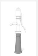
SW.131.4 Support de pompe 70