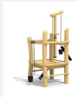
SW.070.2.R Le chantier moyen - en