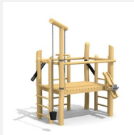
SW.080.R Le grand chantier en bois de robinier