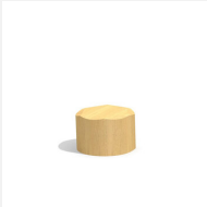
MO.04.12.20.R Tabouret en rondin 20 cm à