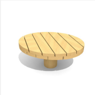
SW.040.2.35.R Table de jeu de sable 2, H 35 cm