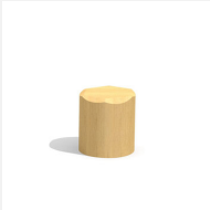
MO.04.12.30.R Tabouret en rondin 30 cm à