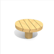
SW.040.1.35.R Table de jeu de sable 1, H 35 cm