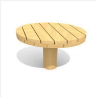
SW.040.2.50.R Table de jeu de sable 2, H 50 cm