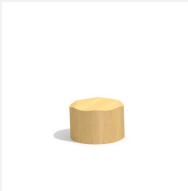
MO.04.12.20.R Tabouret en rondin 20 cm à