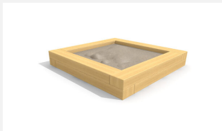
SW.014.20.H Bac à sable haut 2.0 x 2.0 m - style