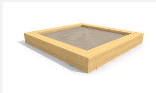
SW.014.25.H Bac à sable haut 2.5 x 2.5 m - style