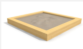
SW.014.30.H Bac à sable haut 3.0 x 3.0 m - style