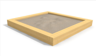
SW.014.30.H Bac à sable haut 3.0 x 3.0 m - style