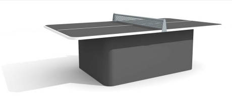
SP.011.13.A Table de ping-pong arrondie box anthracite