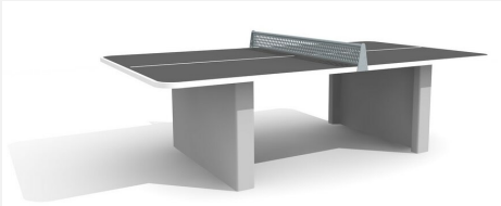
SP.011.12.A Table de ping-pong arrondie beton anthracite