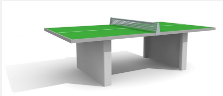
SP.010.12.G Table de ping-pong verte, socle en béton