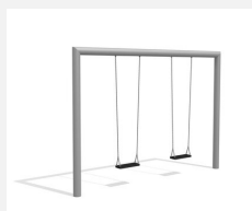
SC.160.2.I Balançoire rectangle 2 places inox