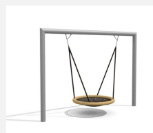
SC.162.3.I Nid d'oiseau rectangle inox