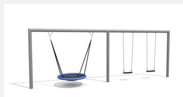
SC.162.32 Combiné balançoire rectangle - nid d'oiseau