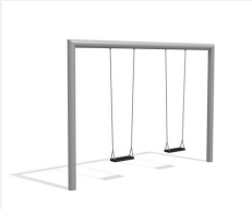
SC.160.2.I Balançoire rectangle 2 places inox