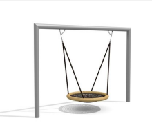
SC.162.3.I Nid d'oiseau rectangle inox