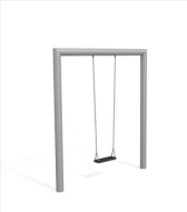
SC.160.1.I Balançoire rectangle 1