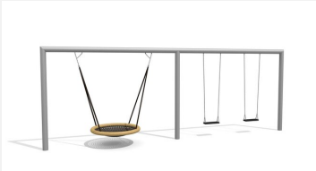
SC.162.32.I Combiné balançoire rectangle - nid d'oiseau inox