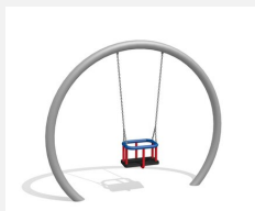
SC.151.I Balançoire lunaire (pour les petits) inox