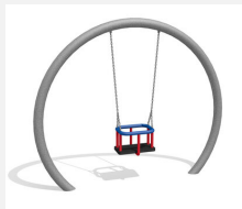
SC.151 Balançoire lunaire (pour les petits)