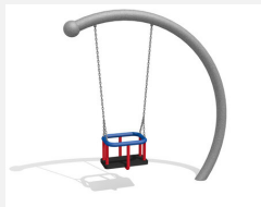
SC.150 Balançoire demi-lune (pour les petits)