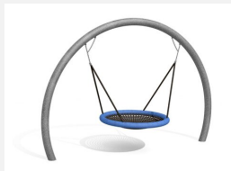
SC.153.3 Le nid d'oiseau lunaire