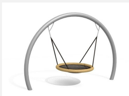
SC.153.3.I Le nid d'oiseau lunaire inox