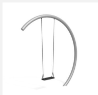
SC.152.I Balançoire demi-lune (grande) inox