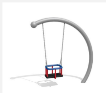
SC.150.I Balançoire demi-lune (pour les petits) inox