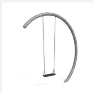
SC.152 Balançoire demi- lune (grande)