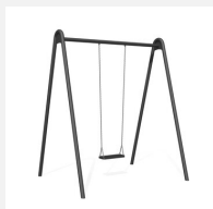
SC.121.1.C Balançoire métallique zinguée