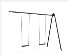
SC.120.8.C Balançoire métallique à appondre 2 places color