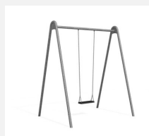
SC.121.1 Balançoire métallique zinguée