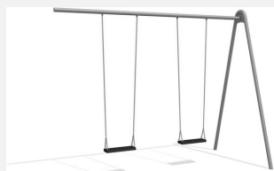
SC.120.8 Balançoire métallique à appondre 2 places