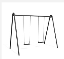
SC.121.2.C Balançoire métallique 2 places