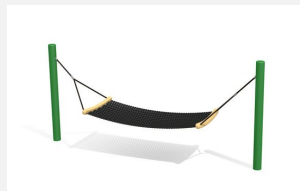
SC.110.3.C Hamac confort color