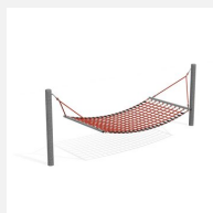
SC.110.1 Hamac XL