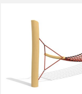
SC.110.98 Suppl. de prix pour limitation