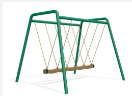
SC.084.5.M Balançoire viking 5 places