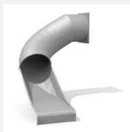
RU.100.15.L Toboggan tunnel à gauche 90°, 150