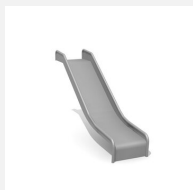
RU.093.10 bimbo toboggan de pente inox H