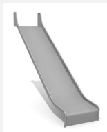
RU.093.25.B bimbo toboggan de