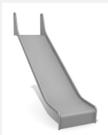
RU.093.20.B bimbo toboggan de