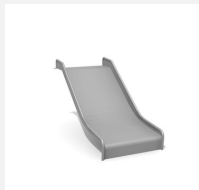
RU.093.10.B bimbo toboggan de pente inox large H