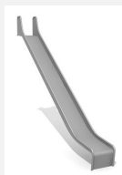
RU.093.25 bimbo toboggan de