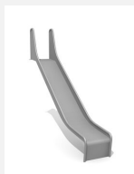
RU.093.15 bimbo toboggan de