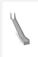
RU.093.20 bimbo toboggan