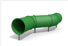
RU.081.30 Tunnel à ramper, libre, s 400 cm