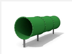
RU.081.10 Tunnel à ramper, libre, droit 320 cm