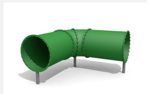
RU.081.20 Tunnel à ramper, libre, angle 90°