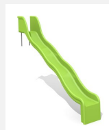
RU.010.20.W Toboggan ondulé de