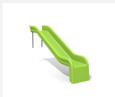
RU.010.10 Toboggan de pente 100 cm