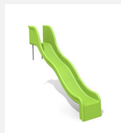
RU.010.15.W Toboggan ondulé de pente