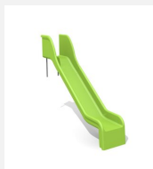
RU.010.15 Toboggan de pente 150 cm