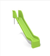
RU.010.15 Toboggan de pente 150 cm