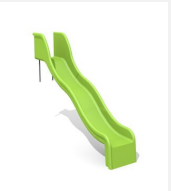
RU.010.15.W Toboggan ondulé de pente