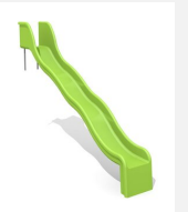
RU.010.20.W Toboggan ondulé de