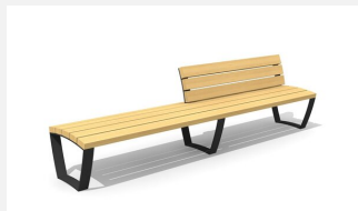
MO.17.22.R Banc 300 cm avec dossier partiel