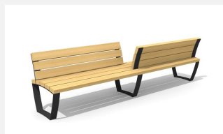
MO.17.24 Banc cado levis avec dossiers partiels