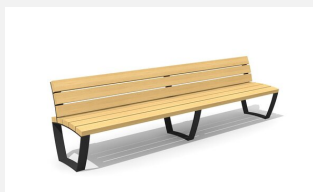
MO.17.23 Banc cado levis avec dossier 300 cm