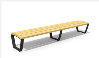
MO.17.21 Banc cado levis sans dossier 300 cm