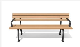
MO.09.01.HA Banc Bit avec accoudoirs