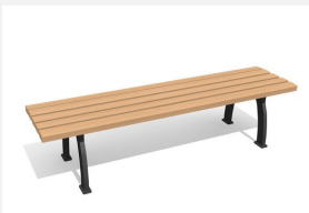
MO.09.02.H banc Bit sans dossier en bois dur