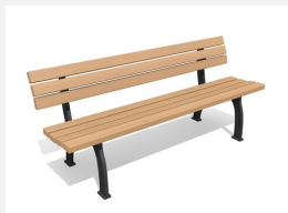
MO.09.01.H Banc Bit en bois dur