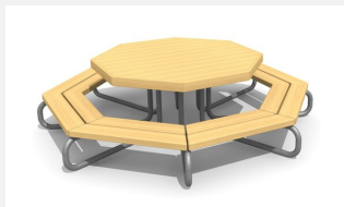
MO.04.03.02 Table octogonale pour enfants