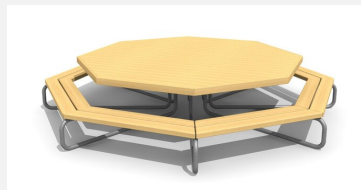
MO.04.03.08 Table octogonale XL - env. 30 enfants