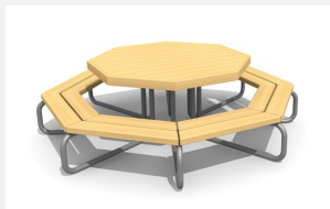
MO.04.03.00 Table octogonale