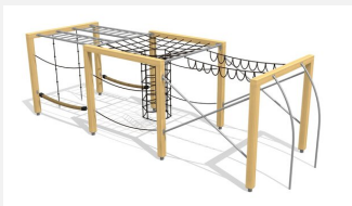
KL.150.4.25 Cube de grimpe en bois 3, hauteur 250 cm