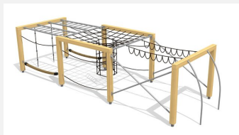
KL.150.4.20 Cube de grimpe en bois 3, hauteur 200 cm