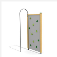
KL.080.1 Paroi d'escalade 1 en bois