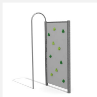
KL.080.1.M Paroi d'escalade 1 en métal