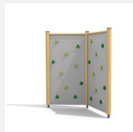
KL.080.2 Paroi d'escalade 2 en bois