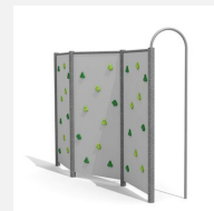
KL.080.3.M Paroi d'escalade 3 en métal