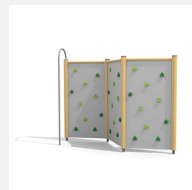
KL.080.3 Paroi d'escalade 3 en bois